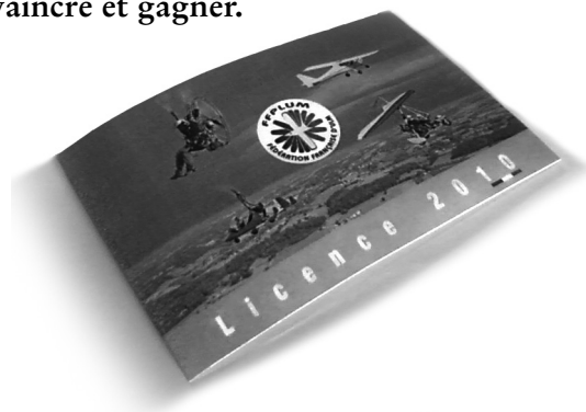
Dominique Mereuze Président de la FFPLUM